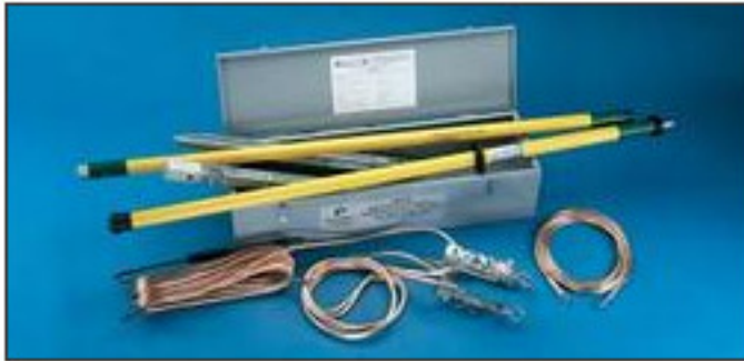
Fig. 10 Dispositivo mobile (portatile) di messa a terra ed in corto circuito per linee a MT