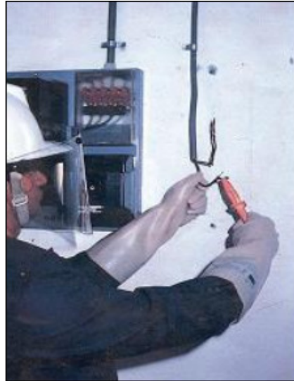
Fig. 9 Operatore sotto tensione