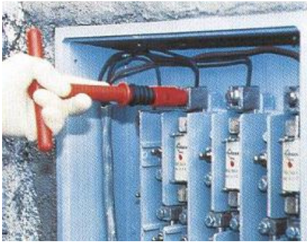
Fig. 8 Chiave a T isolata.